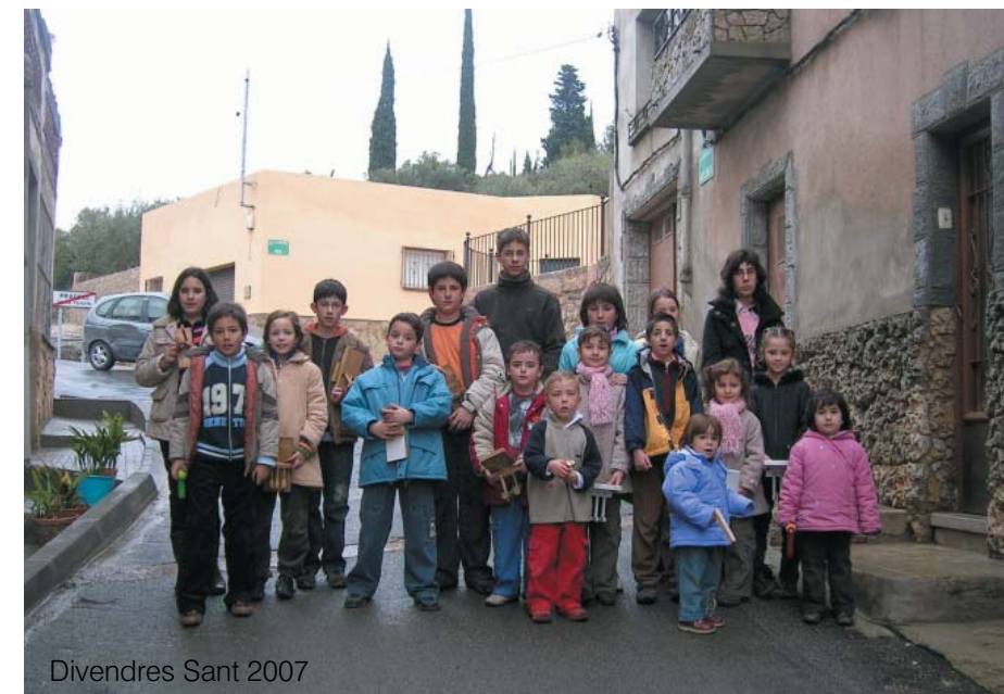
Divendres Sant 2007

Però, independentment de la seva funció original, la sortida al carrer dels nens amb aquest instrument de fusta s'ha convertit en un punt de trobada i diversió pels més petits i no tant petits, i desperta curiositat als forasters. Per tant, hem d'estar orgullosos que al nostre poble es mantinguin les tradicions.