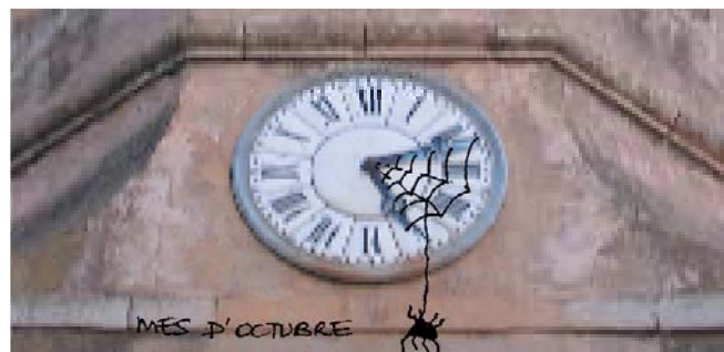
Al mes d'octubre